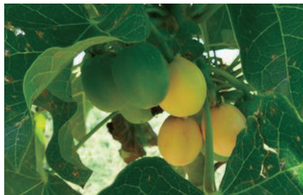
図1 非食用油脂原料のジャトロファ

ジャトロファ油を原料とするバイオディーゼル燃料を、フローマイクロリアクターで合成する方法を開発した。ジャトロファは食料生産と競合しない油料作物であるが、有害な発がん促進物質を含む。本研究室では、フローマイクロリアクターによるバイオディーゼル燃料製造と同時に、発がん促進物質を分解することに成功した。