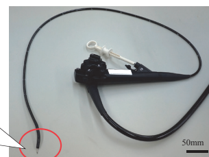
▲経鼻内視鏡挿入後