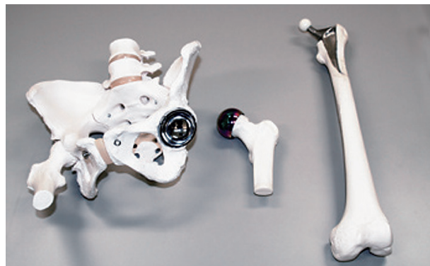
▲医学や生化学の知識・技術のほか、画像処理や切削加工を駆使し、「日本人にジャストフィットする人工股関節」の製作に成功しました。

「当研究所では、医工連携に基づいた人間にやさしい医療機械の創製をおこなっています。」