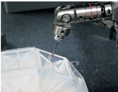
▲脳磁計の性能を確認するための検査標準（ファントム）の校正を行っている様子。

当研究所で開発した脳磁計の技術は民間企業に技術移管され、医療機器あるいは脳機能研究の機器として販売され、顧客は日本国内だけではなく、北米、欧州、豪州、中東、アジアにも広がっています。開発された脳磁計の今後の応用範囲を拡大するためにBrain Assist Suitesの研究も進めています。また、脳磁計で培ったデバイス技術や計測解析に係わるシステム化技術は、脊磁計や心磁計などの生体磁場測定システムにも応用され、今後の産学連携により、実用化を待つばかりになっております。その他、資源探査システム、地磁気モニターシステム、非破壊検査システムなどへの応用研究も進めており、近い将来の実証を目指しています。