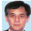
山口 照英 教授・理学博士

http://www.kanazawa-it.ac.jp/wwwr/lab/iameta/