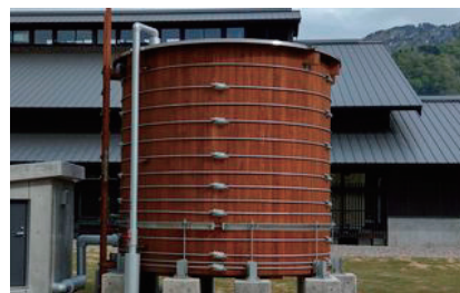
図2 漆塗木槽(白山麓キャンパス)