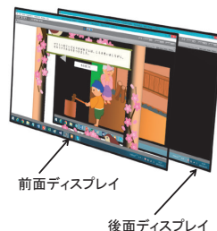
図1 童話を題材としたコンテンツ制作例。

この表示方式では装置構成が特殊になり、それを克服する魅力あるアプリケーションが創出されていないため普及には至っていない。新たなメディア表現のツールとしての確立を目指し、具体的なアプリケーションを想定したストーリー性のあるコンテンツ制作から効果的な表現方法を見出すことを目的に研究を進めている。