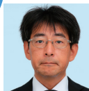
黒瀬 浩 教授・博士(情報学)