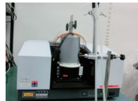
分析装置:ICCDカメラ(Ultra NEO, NAC)、FTIR(IR-Affinity-1、島津製作所)など