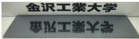
図2鏡面スライシングした加工面