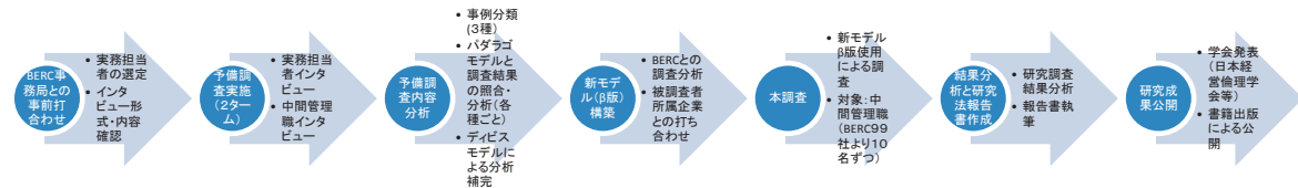
「企業の間管理職の倫理的問題の解決手順についての研究」実施フロー

(本研究は平成23～26年日本学術振興会科学研究費補助金(基盤研究C)の研究課題である)