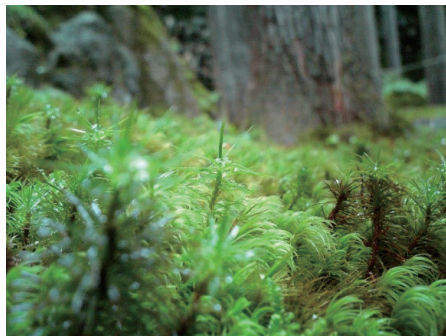
図 身近にあるコケ植物により生活空間を豊かにする

熱・水収支特性に関する屋外実験、(2)人工被覆面に生育するコケ植物に関する調査と暴露試験、(3)コケ植物の景観心理に関する分析に取り組んでいる。