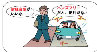
骨導音と気導音を利用したイヤホンマイクの利用イメージ図