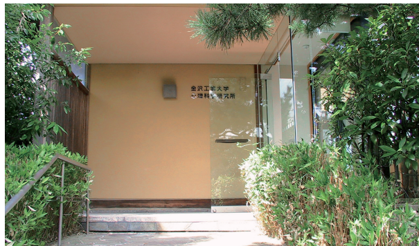
▲心理科学研究所のエントランス。リラックスした雰囲気の中、研究が行われている。

多くの場合は、実践活動を伴う研究です。すなわち、各種心理学的なワークショップや、研修を実施しながら、参加者のウェルビーイングの増進を図りながら、研究を行っています。PERMAモデルにもとづく心理検査を開発し、これらを活用しながら、実証的に効果を検証しています。