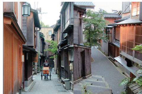
▲重要伝統的建造物群保存地区指定時に調査を行った主計町