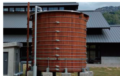
図2 漆塗木槽 (白山麗キャンパス)