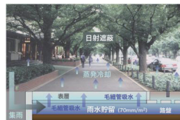
図 蒸発冷却舗装システムの基本構成と適用空間イメージ

これまでの研究で、面的な雨水貯留と舗装体の毛管吸水に着目した「蒸発冷却舗装システム」の基本構成を提案し、屋外実験により十分な冷却性能を確認してきた。今後は実用化に向けて、1)白華を抑制する舗装プロックの開発、2)有効保水量(毛管水みちが途切れるまでの蒸発量)の大きい舗装体構成の開発を行う。