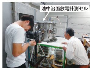
油中沿面放電現象の計測実験