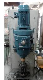
MR流体の伝達応力測定装置