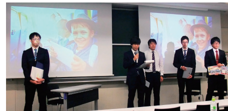
平成29年9月に東京で行われたエクスターンシップのセミナーにて研究活動の成果を発表する学生たち

本学は平成26年から米国の航空機製造会社による半年間のエクスターンシップに参加している。本研究では、エクスターンシップが21世紀型スキルの育成と外国語習得に与える効果を測定し、カリキュラムでの活用法を探ると共に、21世紀スキルと外国語スキルを包括したアセスメント方法を検証する。