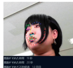
機械学習による画像認識の例

文部科学省が平成24年に実施した「通常の学級に在籍する発達障害の可能性のある特別な教育的支援を必要とする児童生徒に関する調査」に基づき推定の上、作図した。