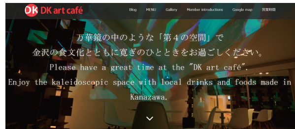
図2 地域創生ベンチャー企業・DK art caféのホームページ