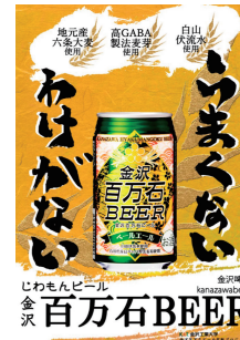
図2 金沢百万石ビール 金沢 百万石 BEER じわもんビール kanazawabeer 地元産 六次産業 活用 高GABA 製法を学ぶ 自由 伏見水 活用