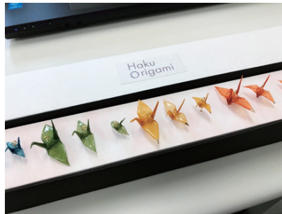
図1 箔折紙・金箔の箔打紙を使用した加賀五彩で彩色されたお土産用のアクセサリー市場調査・分析・戦略立案・ネットワークングを共創

松林研究室では専門分野である経営学・マーケティングテクノロジーを効果的に活用した新商品開発やプロモーション戦略の研究をしています。具体的には、Needs, STP, 4Pの基本的な市場調査、並びに戦略分析から最新のビックデータを活用した統計学的な分析も加えて企業にとって最適なマーケティング戦略“なぜ売れないのか?どうしたら売れるのか?”を企画、立案、並びに実行支援します。