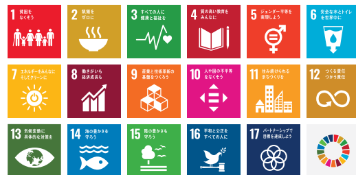
SDGsの17の目標(国連広報センターウェブサイトより)