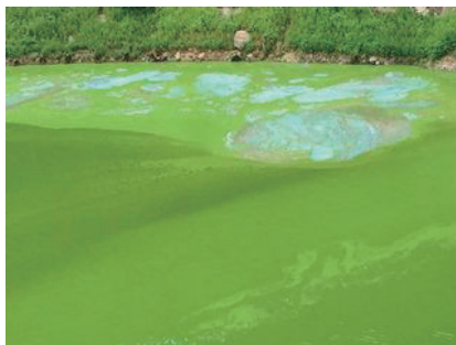
図1 湖で発生したアオコ

従来の浄水プロセスや排水処理プロセスでは分解・除去が困難な臭気物質、色素、医薬品などの化学物質を分解・除去する方法を開発している。活性炭および新規に開発された吸着剤を用いた臭気物質吸着処理プロセスを開発中である。また、色素・医薬品などの酸化剤や微生物による分解処理技術を開発してきた。