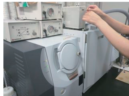
図2 GC-MSによる臭気物質分析