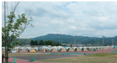
写真1 運動場に設けられたテント