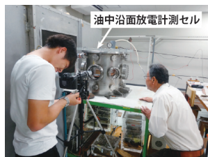
油中沿面放電現象の計測実験