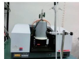
分析装置:ICCDカメラ(Ultra NEO、NAC)、FTIR(IR-Affinity-1、島津製作所)など