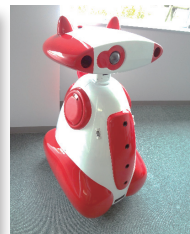
図1: 匂い識別機能を有するロボット。写真は、市販された留守番ロボット(左)と火災早期検知を目的に開発されたロボット(右)

図2: ガス源探索ロボット。写真は、センサ・アクチュエータ間を直接的に結合するガス源探索ロボット(左)と、マルチコプタの各ロータ内にガスセンサを置く独自のガスセンサ配置を有する3次元ガス源探索ロボット(右)