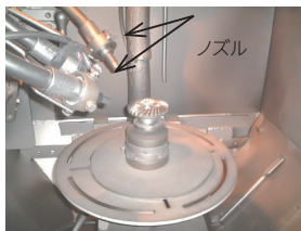
図2. 微粒子処理装置の例