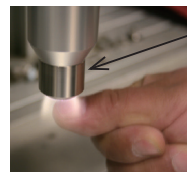
大気圧プラズマ 低温で安全