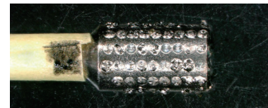
図2 Φ3mmチタン棒に200μm砥粒を固着した工具

ダイヤモンド砥粒の固着力が高い工具、人体に対して影響を与えない工具、作業者が望む特殊形状の工具を作業現場で作製できる等様々な工具の製造を実現するために、従来の工具作製法とは全く異なった方法として、レーザで工具の台金表面を溶融し、その溶融部に砥粒を固着するレーザ溶融システムを開発した。