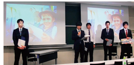
平成29年9月に東京で行われたエクスターンシップのセミナーにて研究活動の成果を発表する学生たち

(本研究は平成30～令和2年日本学術振興会科学研究費補助金(基盤研究C)の助成を受けています。)