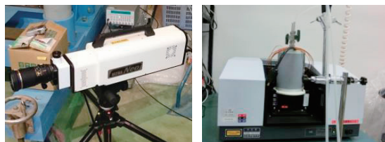
分析装置:ICCDカメラ(Ultra NEO、NAC)、FTIR(IR-Affinity-1、島津製作所)など