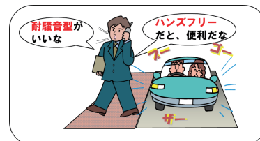
骨導音と気導音を利用したイヤホンマイクの利用イメージ図