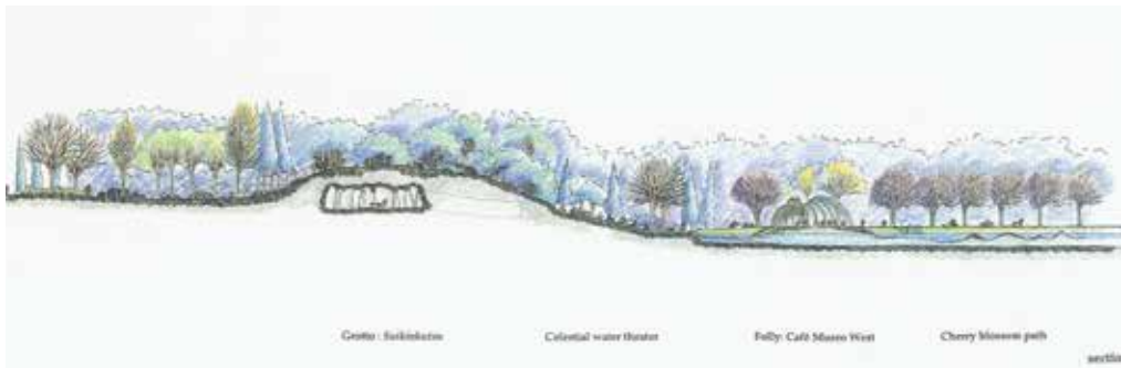
トゥーランティ湖公園国際設計競技 ヘルシンキ・フィンランド 1997.