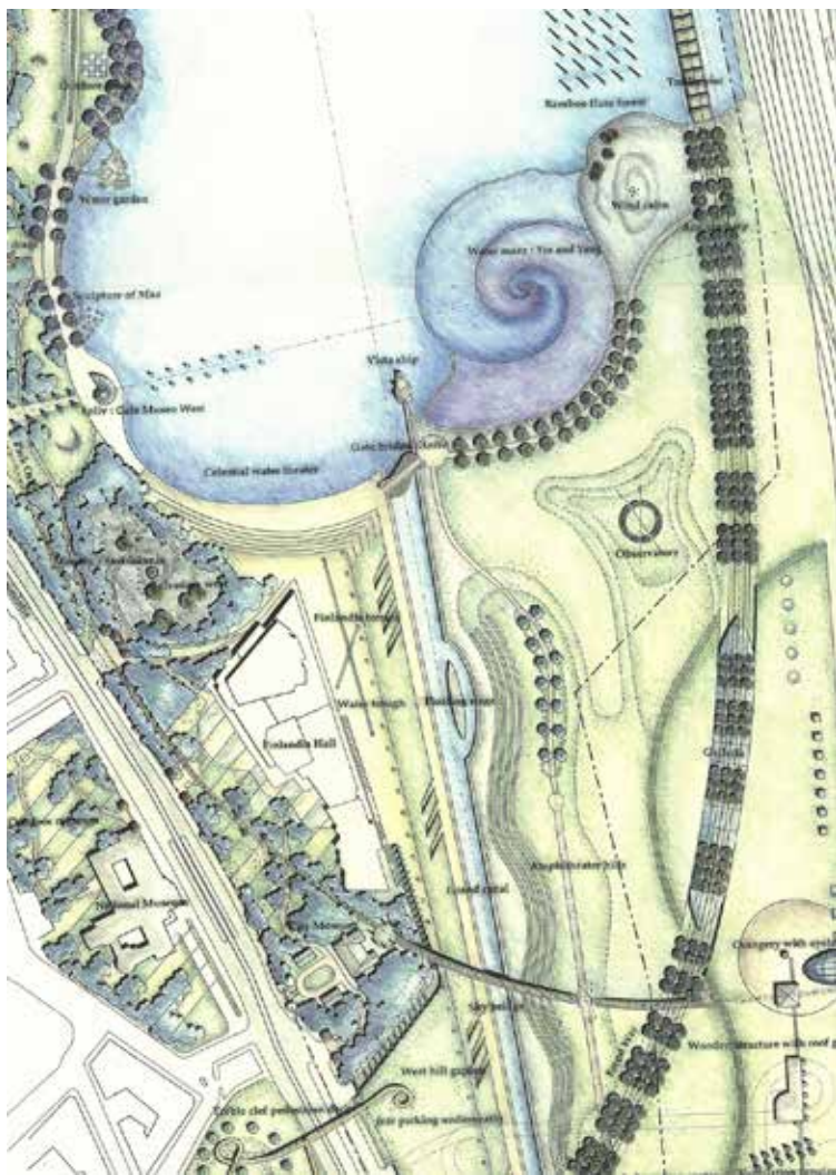
トウラーテンティ湖公園国際設計競技 ヘルシンキ・フィンランド 1997.