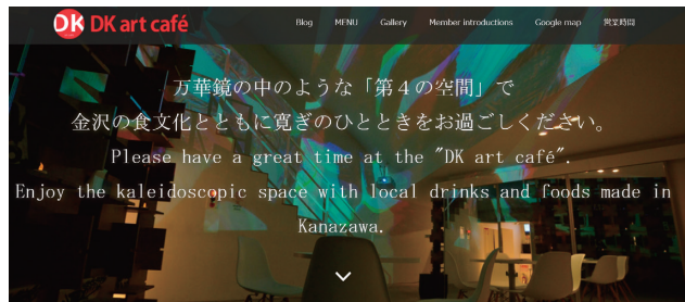
図2 地域創生ベンチャー企業・DK art caféのホームページ

これまでの経歴・実績を踏まえて地元企業に貢献することはもちろん、加えて地元ベンチャー企業のお役に立てます様な事例や事業戦略の提供、並びに世界規模のネットワーキングをサポートしたいと考えています。