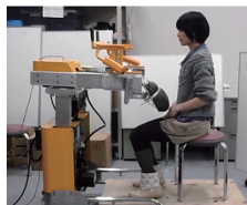
立ち上がり動作を支援する機器