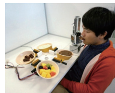
音声で操作できる食事支援システム