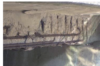
図2. 塩害の生じた部材

今後、土木や建築の分野では、既設構造物のメンテナンスが重要な業務になると思われます。新しい構造物の建設で培った技術を、古くても大切な構造物の維持管理に応用したいとお考えの方は、是非とも当研究室のセミナーに御参加下さい。