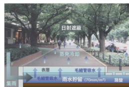
図 蒸発冷却舗装システムの基本構成と適用空間イメージ

これまでの研究で、面的な雨水貯留と舗装体の毛管吸水に着目した「蒸発冷却舗装システム」の基本構成を提案し、屋外実験により十分な冷却性能を確認してきた。今後は実用化に向けて、1)白華を抑制する舗装ブロックの開発、2)有効保水量（毛管水みちが途切れるまでの蒸発量）の大きい舗装体構成の開発を行う。