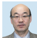
垂水 弘夫 教授

排湿外壁構造の実用化は、建築が設備の稼働に頼らず、内外の水蒸気圧力差を活用して、まさに自律的に屋内の湿気問題を解消できる点で、時代が要求する低炭素建築・低炭素社会の構築に寄与する方途の一つと考えられる。