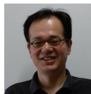
中沢 実 教授

記載しているのは、脳波推定と車椅子の自動制御を組み合わせたものであるが、これ以外にも、画像処理・情報通信技術を実施しており、今後のIoTへの対応が進むにつれ、重要な技術は常に把握しています。興味のある方は是非ご相談下さい。