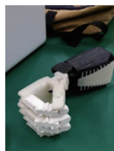
筋電義手や短下肢義足