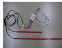
看護や介護をたすける支援機器の例

表面筋電位計・積分筋電位計、体圧分布計、足裏圧分布計（固定型・移動型）、圧力計測用シート等の各種計測装置を備えています（ビデオ画像と同期したデータ収集が可能です）。また、筋骨格モデル構造解析ソフト、制御系設計及びシミュレーションソフトを備えております。