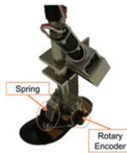
筋電義手や短下肢義足