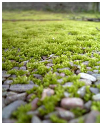
いつもの通学路をよく見ると・・・

(3)見てきたコケ庭を参考に、実際のコケ植物を用いて箱庭(小さいコケ庭)を作ります。自分だけの素敵なコケ庭をデザインしましょう。