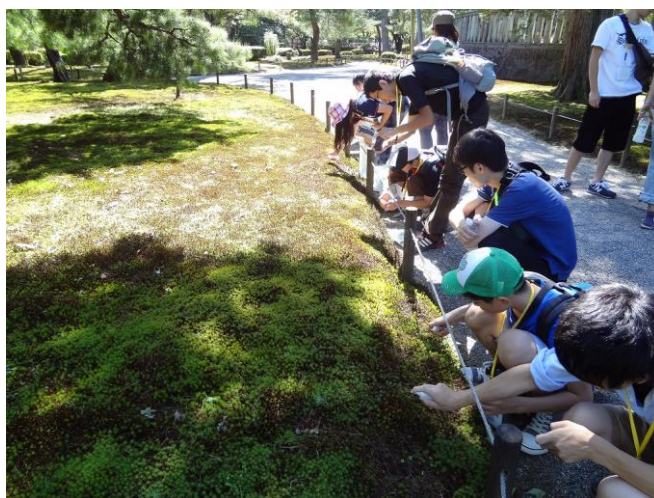
コケはさわるとフカフカ。水をかけると葉が開いて色もあざやかに